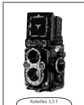
Rolleiflex 3,5 F 1958