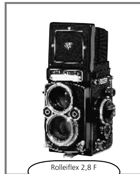
Rolleiflex 2,8 F 1960