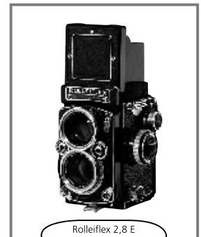
Rolleiflex 2,8 E 1956