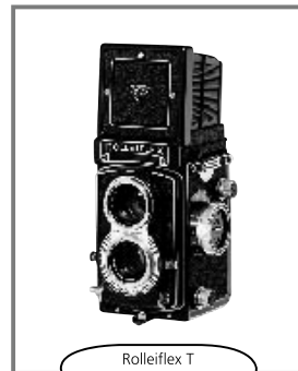
Rolleiflex T 1958