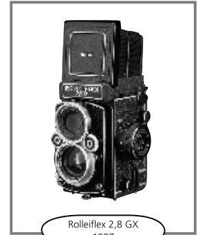
Rolleiflex 2,8 GX 1987