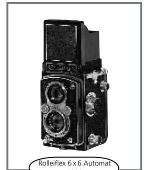
Rolleiflex 6 x 6 Automat 1938