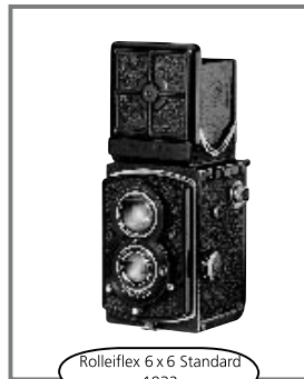
Rolleiflex 6 x 6 Standard 1932