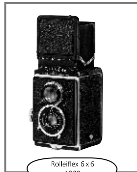
Rolleiflex 6 x 6 1929