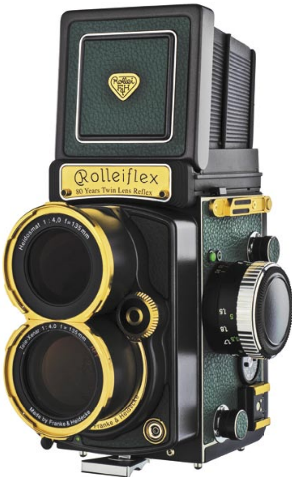
Die Merkmale der zweiäugigen Rolleiflex im Detail: